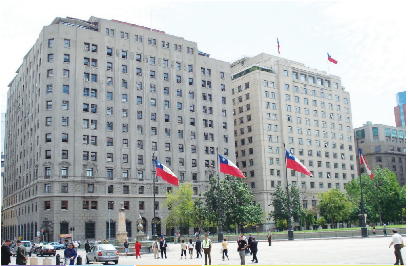
Ministerio de Hacienda