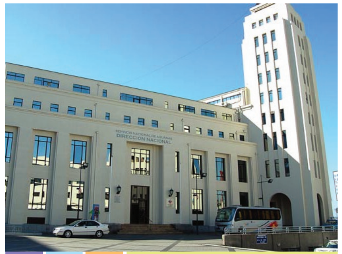
Servicio Nacional de Aduanas

Contribuye al crecimiento y competitividad de la economía nacional, protegiendo los intereses del país y sus ciudadanos, a través de la fiscalización, facilitación y aseguramiento de la cadena logística de comercio exterior, promoviendo el cumplimiento voluntario de las normas aduaneras, en un clima de confianza y cooperación, conforme a los principios de integridad y transparencia.