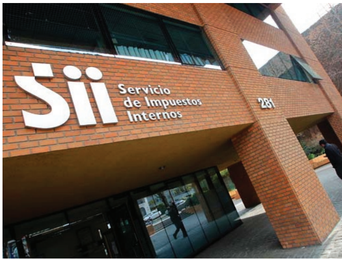
Servicio de Impuestos Internos

La misión del SII es “Fiscalizar y proveer servicios, orientados a la correcta aplicación de los impuestos internos; de manera eficiente, equitativa y transparente, a fin de disminuir la evasión y proveer a los contribuyentes servicios de excelencia, para maximizar y facilitar el cumplimiento tributario voluntario. Realizado por funcionarios competentes y comprometidos con los resultados de la Institución”.