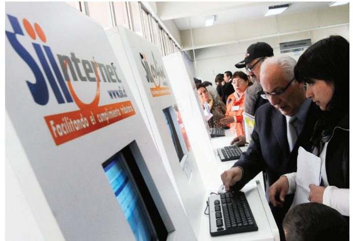
Módulos de Autoatención

¿Cómo se hace para?, Demos Educativos, Calendario Tributario, Mesa de Ayuda Telefónica, Oficinas del SII, Material Informativo, y Aprenda Sobre.