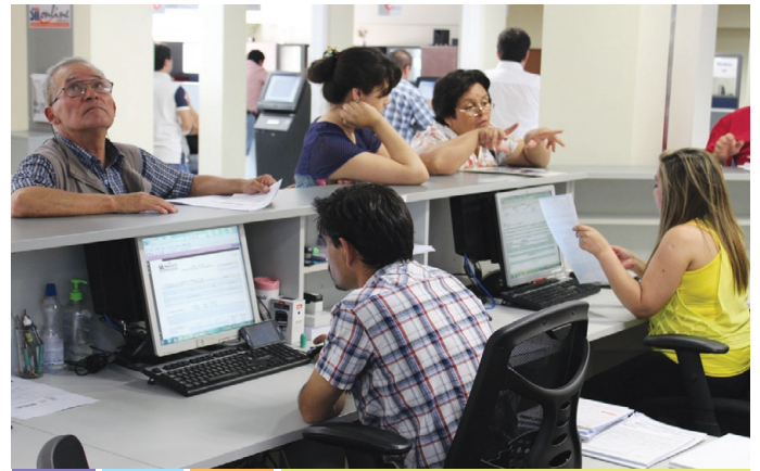
Atención al Contribuyente