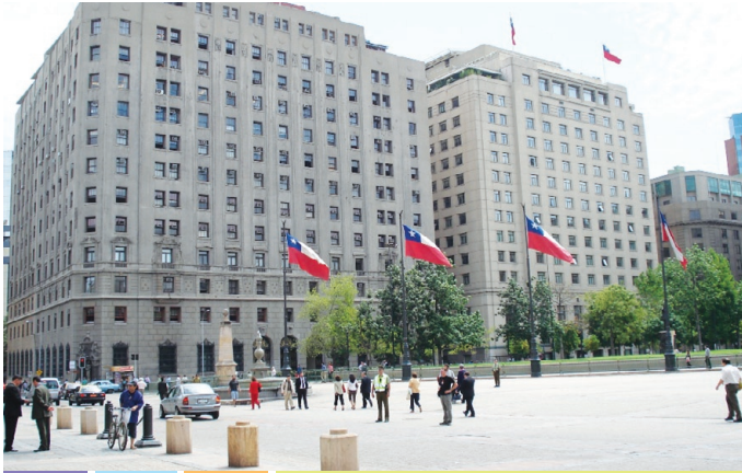
Ministerio de Hacienda

Los servicios públicos son órganos administrativos encargados de satisfacer necesidades colectivas, de manera regular y continua. Sin perjuicio de la realización de las actividades necesarias para el cumplimiento de sus funciones propias, les corresponde según la ley, aplicar las políticas, planes y programas que apruebe el Presidente de la República a través de los respectivos ministerios, pues aun cuando fuesen creados para actuar en todo o parte de una región, siempre quedarán sujetos a las políticas nacionales y a las normas técnicas del respectivo sector.