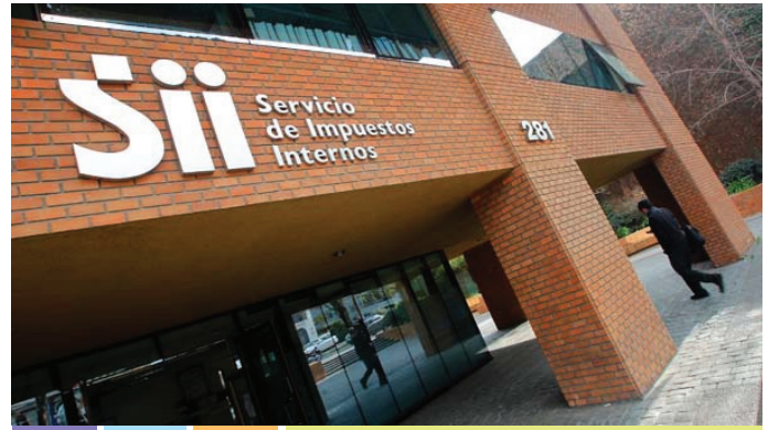
Servicio de Impuestos Internos

órdenes a fin de asegurar su aplicación y fiscalización.